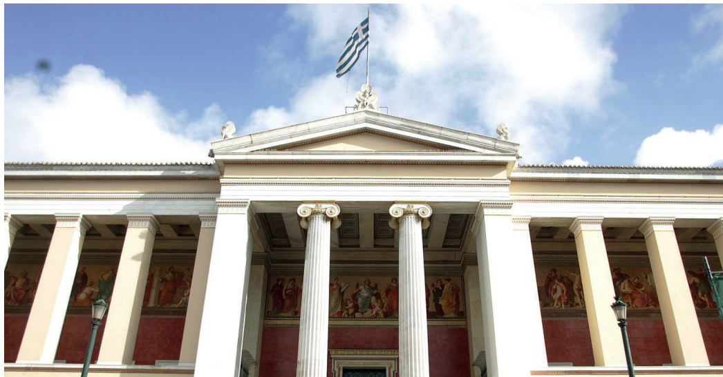
Εθνικό και Καποδιστριακό Πανεπιστήμιο Αθηνών Афинский Национальный Университет имени Каподистрии